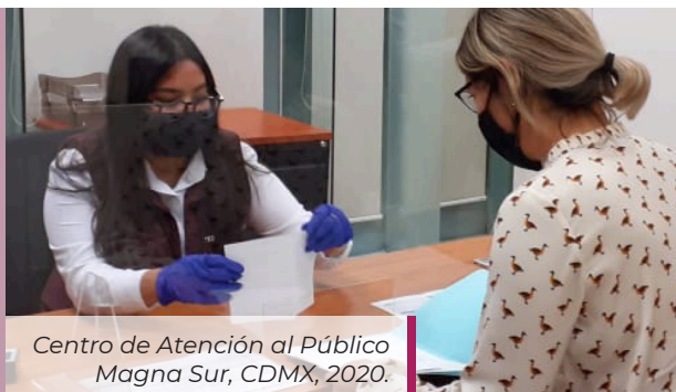
Centro de Atención al Público Magna Sur, CDMX, 2020.

Cabe mencionar que en caso de que se presente un caso sospechoso o positivo del virus SARS-CoV2, la oficina afectada procederá a su cierre y se aplicará un protocolo que incluye llevar a cabo el debido proceso de desinfección, así como observar el período de cuarentena (14 días), recomendado por las autoridades de salud en nuestro país. Una vez completado el protocolo, se permitirá la reapertura de las instalaciones. Estos casos se informan puntualmente al público en general, a través de nuestras redes sociales.