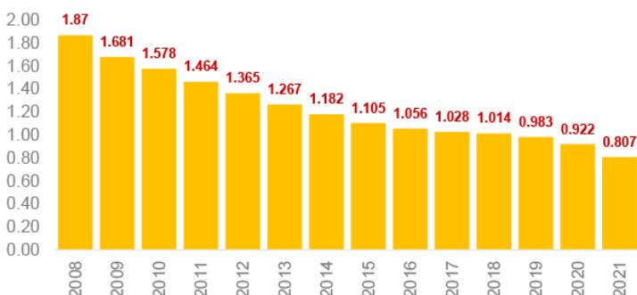
Comisiones sobre saldo (% sobre saldo administrado)