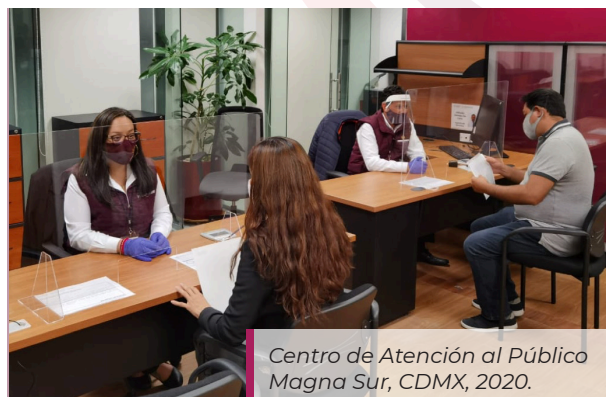
Centro de Atención al Público Magna Sur, CDMX, 2020.

por ello, aplicamos encuestas de satisfacción a todos nuestros cuentahabientes, mismas que nos ayudan mejorar día a día, por lo que te pedimos que al finalizar la atención dediques unos minutos más para contestarla, el Agente de Servicio que te atendió te solicitará realizarla.